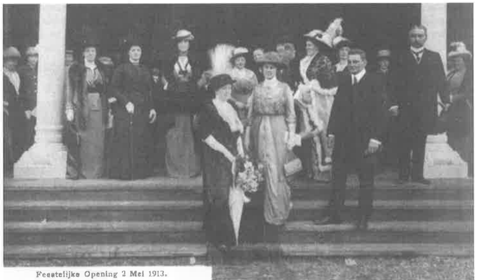
Feestelijke Opening 2 Mei 1913.

In Op het breukvlak van twee eeuwen spreekt Jan Romein over een conservatieve omslag in het feminisme van na de eeuwwisseling, omdat vanaf dat moment de kwaliteiten van