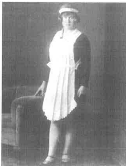
Dienstmeisje (1925) ± 16 jaar oud collectie J.Poelstra

derf onder de dienstboden. Beloningen voor langdurige trouwe dienst en een leesboek vol goede voorbeelden moesten dienstboden leren zich te voegen naar hun meederen. Ook werkgevers werden aangesproken op hun plichten. Het Nut kwam met een instructieboek, 'De behandeling van dienstbaren', dat werkgevers leerde hoe zij de dienstboden "geheel in uwe magt en onder uw bereik" konden krijgen.