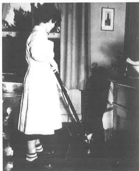
Dagmeisje ca. 1950